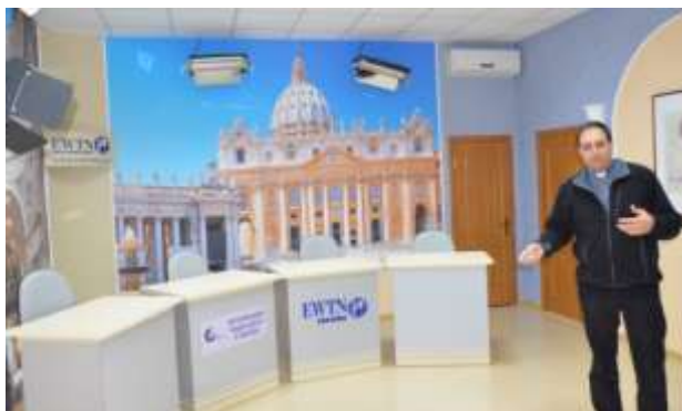
Stora studion för panelsamtal med mera