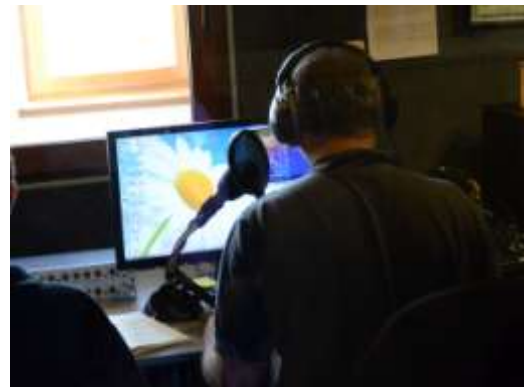
Inläsning av mässans texter i direktsändning