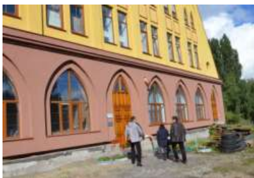
Ingången till Mediacentret